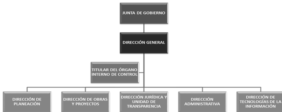
Figura 1. Organigrama del Instituto de la Infraestructura Física Educativa del Estado de Jalisco