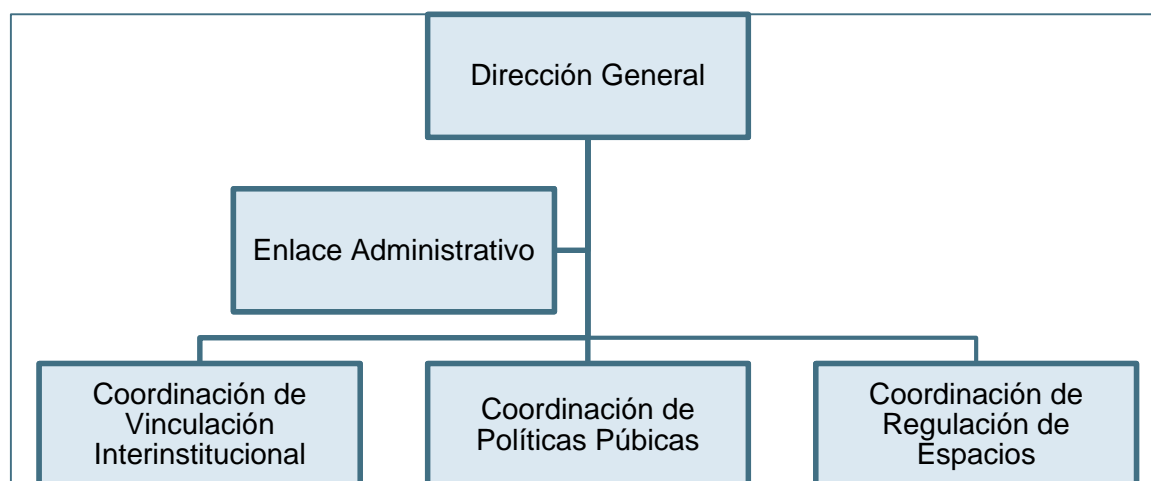
Figura. 1. Organigrama

Fuente: Elaboración propia. Sitio de Transparencia: https://transparencia.jalisco.gob.mx/informacion_fundamental/355